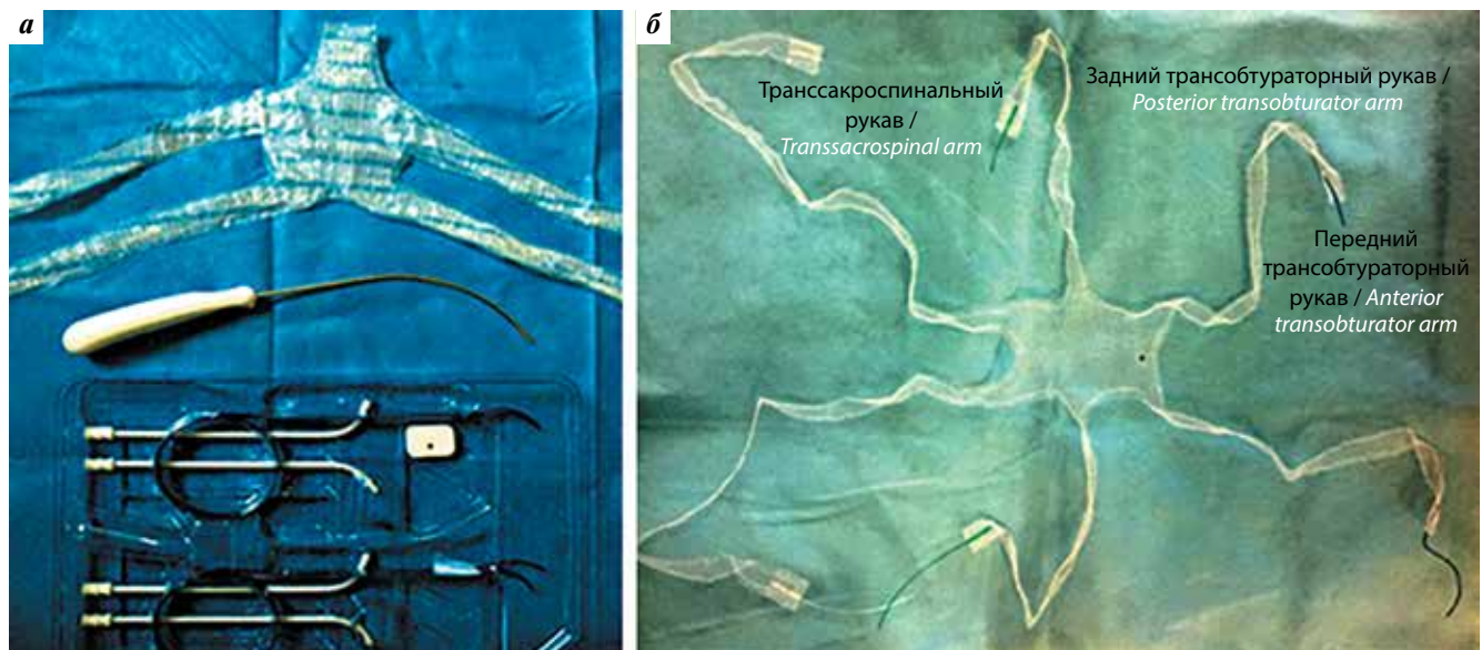
Рис. 1. Исследуемые сетчатые протезы: а – Prolift anterior; б – OPUR Fig. 1. The studied mesh prostheses: а – Prolift anterior; б – OPUR

Протез Prolift anterior устанавливают через продольный разрез передней стенки влагалища. Для вкола троакаров ориентировались на кожные метки. Троакары вводили в полость малого таза по методике out-in. Протез имеет 2 пары рукавов: передние и задние трансобтураторные. Передний трансобтураторный рукав Prolift anterior проводят так же, как и одноименный рукав OPUR. Задний трансобтураторный рукав Prolift anterior выходит практически через сухожильную дугу леваторов рядом с седалищной остью, имитируя кардинальную связку. Протез расправляли под мочевым пузырем; к перешейку матки сетку фиксировали нерассасывающимися лигатурами (рис. 2).